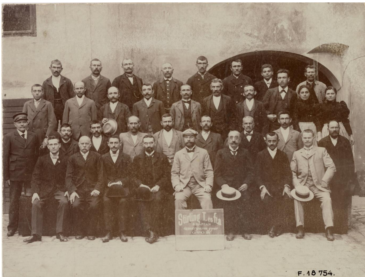
Forrás: Rómer Flóris Művészeti és Történeti Múzeum, Fotógyűjtemény, 18754 Az üzem dolgozói, 1890-es évek végén