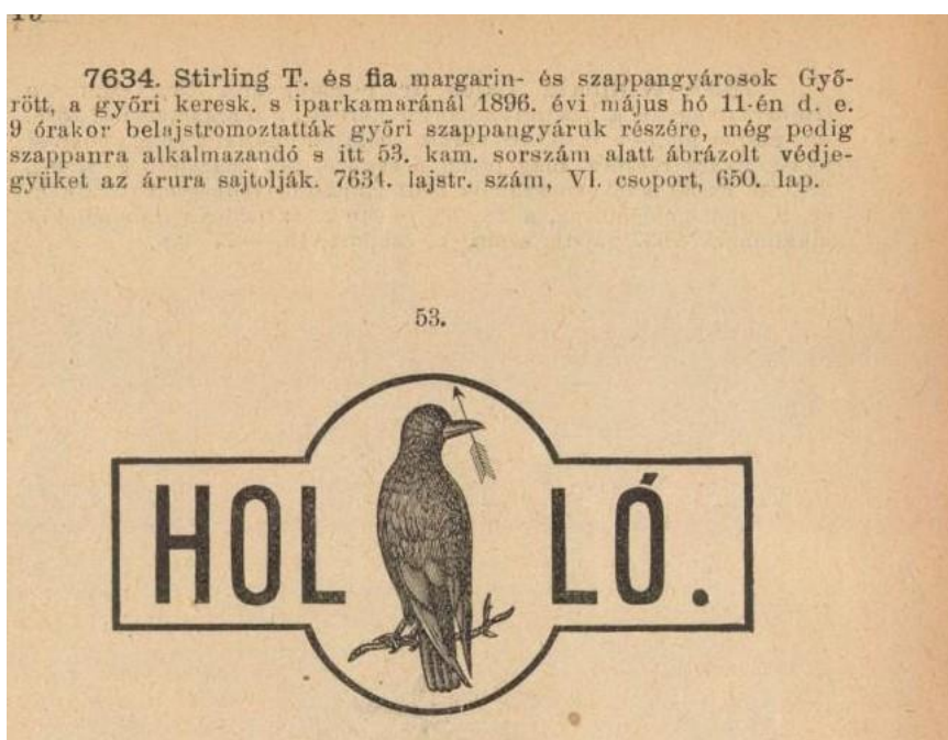
Forrás: Központi Értesítő, 21. évf., 61. sz. (1896. július 26.), 1049.